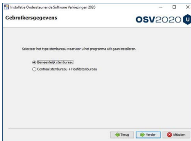
Figuur 1. Keuze GSB- of CSB-module

Kies bij de installatie het juiste stembureauniveau: gemeentelijk stembureau of centraal stembureau.