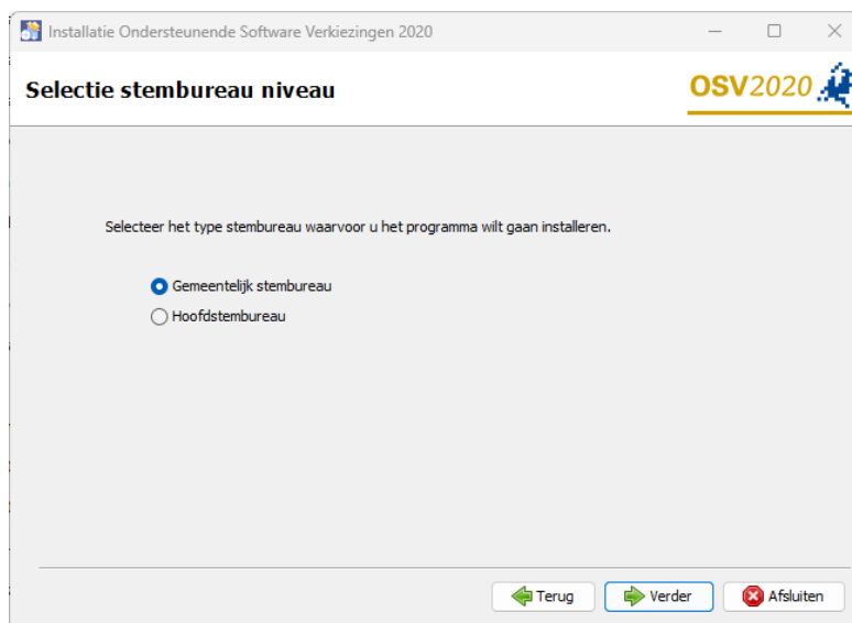
Figuur 1 Tweede Kamer verkiezing keuze GSB of HSB module

U dient bij de installatie het juiste stembureau niveau te kiezen: