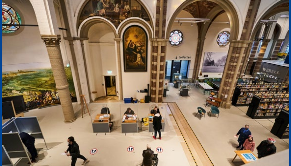
Stemlokaal in de voormalige St. Petruskerk (Vught).