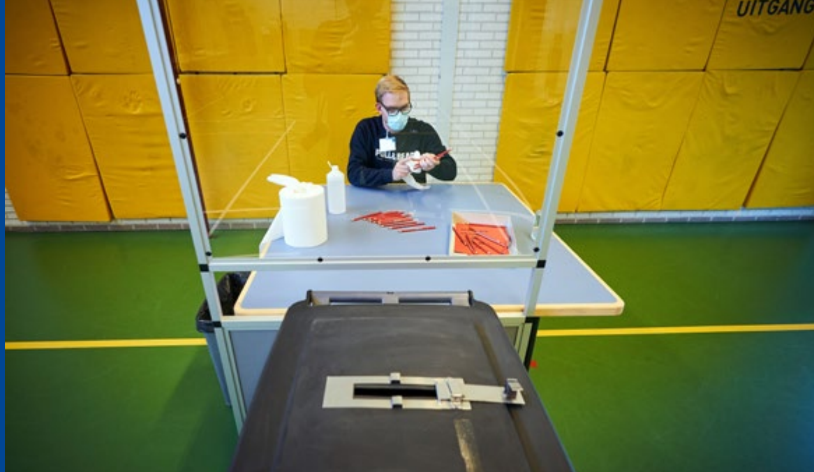
Potloden reinigen (Oisterwijk).