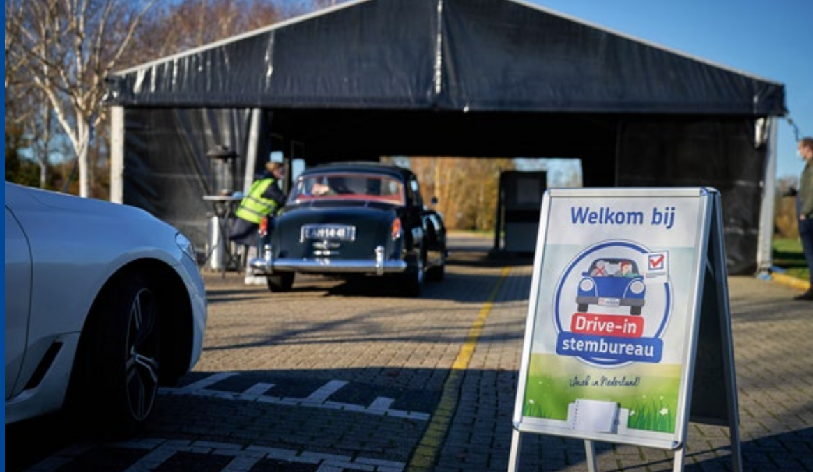
Drive-in stemlokaal (Vught).